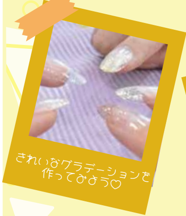
きれいなグラデーションを作ってみよう♡