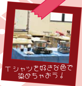
Tシャツを好きな色で染めちゃう！