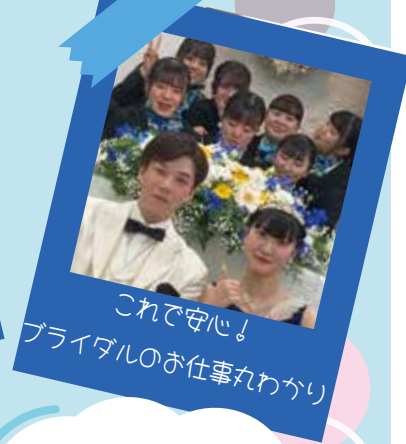
これで安心！ ブライダルのお仕事丸わかり